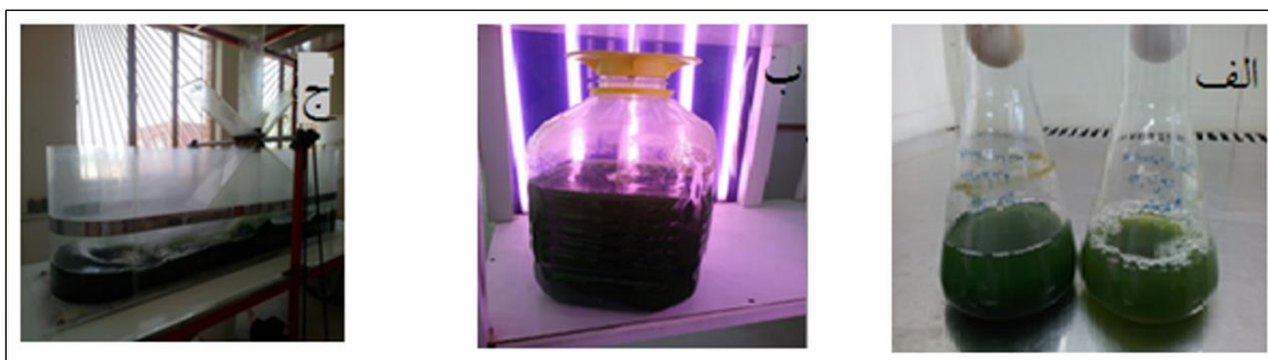
شکل ۱: مراحل مختلف کشت ریز جلبک اسپیرولینا پلاتنسیس در الف) ارلن‌های ۲۵۰ میلی‌لیتری ب) ظروف پت ۲۰ لیتری و ج) حوضچه‌های ۲۵۰ لیتری.

این تحقیق در بهار ۱۳۹۷ در پژوهشکده زیست فناوری سازمان پژوهش‌های علمی و صنعتی ایران شروع شد. کلیه نمک‌های لازم جهت تهیه محیط کشت ریز جلبک اسپیرولینا از شرکت مرک خریداری شد. ترکیب محیط کشت زاروک مورد استفاده شامل سدیم بی‌کربنات به‌عنوان منبع کربنی و ترکیباتی مانند سدیم مولیبدات، سولفات مس، کلسیم کلراید، فروس سولفات به‌عنوان عناصر ضروری بود. روش کشت بدین صورت بود که ابتدا ریز جلبک اسپیرولینا به درون ارلن‌های ۲۵۰ میلی‌لیتری حاوی ۱۵۰ میلی‌لیتر محیط کشت زاروک استریل با pH برابر ۹ تلقیح شد. سپس ارلن‌ها به مدت ۱۴ روز در معرض شدت نوری ۱۸۰ میکرو مول فوتون بر مترمربع بر ثانیه با دوره نوری ۱۲ ساعت نور و ۱۲ ساعت تاریکی و شرایط هوادهی ۲۰۰ میلی‌لیتر در دقیقه، در شیکر با دمای 37^{\circ}\text{C} قرار گرفتند. پس از این مدت به‌منظور افزایش زیست‌توده ریز جلبکی، محتوای ارلن‌ها در ظرف پت ۲۰ لیتری و سپس حوضچه‌های ۲۵۰ لیتری تلقیح شدند (Shanab et al. , 2012). در شکل ۱ مراحل مختلف کشت ریز جلبک اسپیرولینا پلاتنسیس نشان داده شده است.