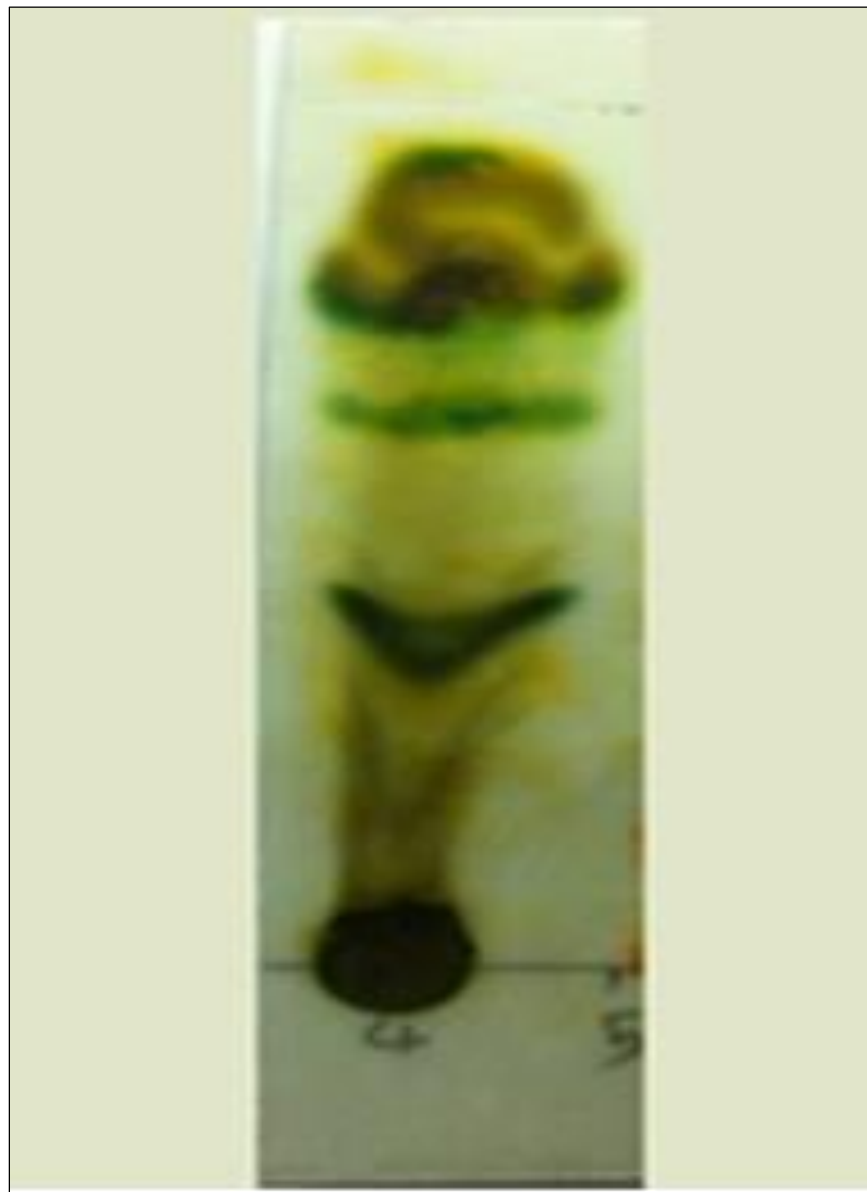
شکل ۳: کروماتوگرافی با لایه نازک عصاره متانولی اسپیرولینا پلاتنسیس.

سنجش مقدار آلکالوئید تام ریز جلبک اسپیرولینا پلاتنسیس با روش تیتراسیون معکوس نشان داد که محتوای آلکالوئید این ریز جلبک در حد 1/8 درصد است. از طرف دیگر سنجش مقدار آلکالوئید اسپیرولینا پلاتنسیس با روش بروموکروزول گرین، نشان داد که به ازای هر گرم زیست‌توده خشک این ریز جلبک، 11/4 میلی‌گرم و به عبارت دیگر 1/14 درصد آلکالوئید وجود دارد که به مقدار تعیین شده توسط روش تیتراسیون معکوس بسیار نزدیک است.