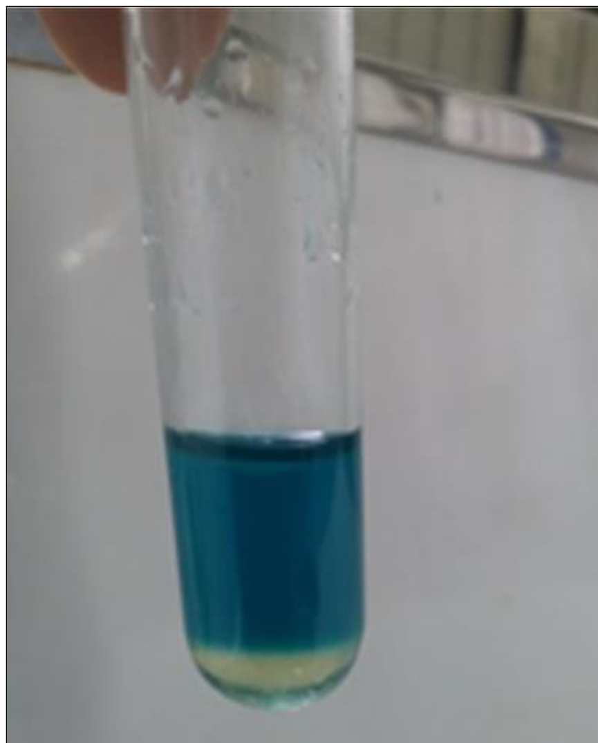
شکل ۲: تأیید حضور آلکالوئید در عصاره اسپیرولینا با ایجاد رنگ زرد حاصل از تشکیل کمپلکس بین بروموکروزول گرین و آلکالوئید.

در مطالعه حاضر وجود آلکالوئیدها در اسپیرولینا پلاتنسیس به‌عنوان یک مدل ریز جلبکی از طریق روش بروموکروزول گرین و مشاهده رنگ زرد در فاز کلروفرمی تأیید شد (شکل ۲). درحالی‌که نتیجه استفاده از معرف‌های مایر و همچنین واکنر جهت تشخیص آلکالوئیدها در این ریز جلبک منفی بود.